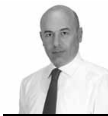
ԱՆՈՏ ՀԱՅՐԱՊԵՏՅԱՆ Կապանի քաղաքապետ